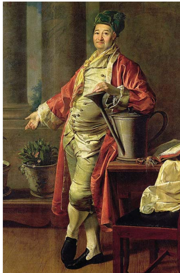
Прокофий Акинфиевич Демидов. Худ. Д. Г. Левицкий. 1773 г. Третьяковская галерея